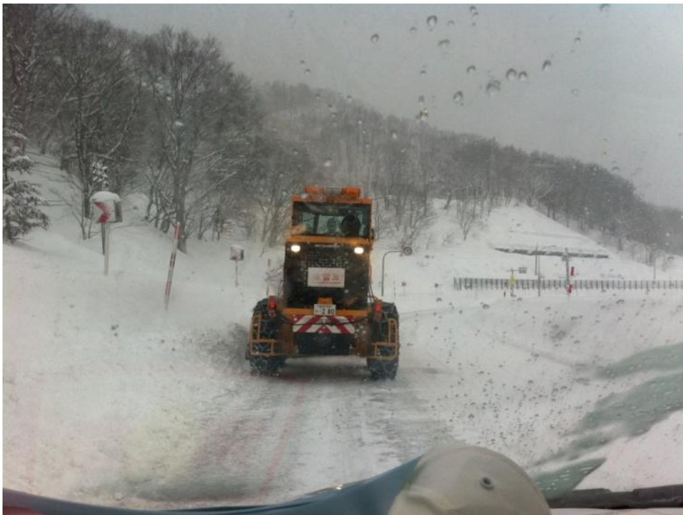
(写真⑤) 山形での猛吹雪の中を進む車の中から