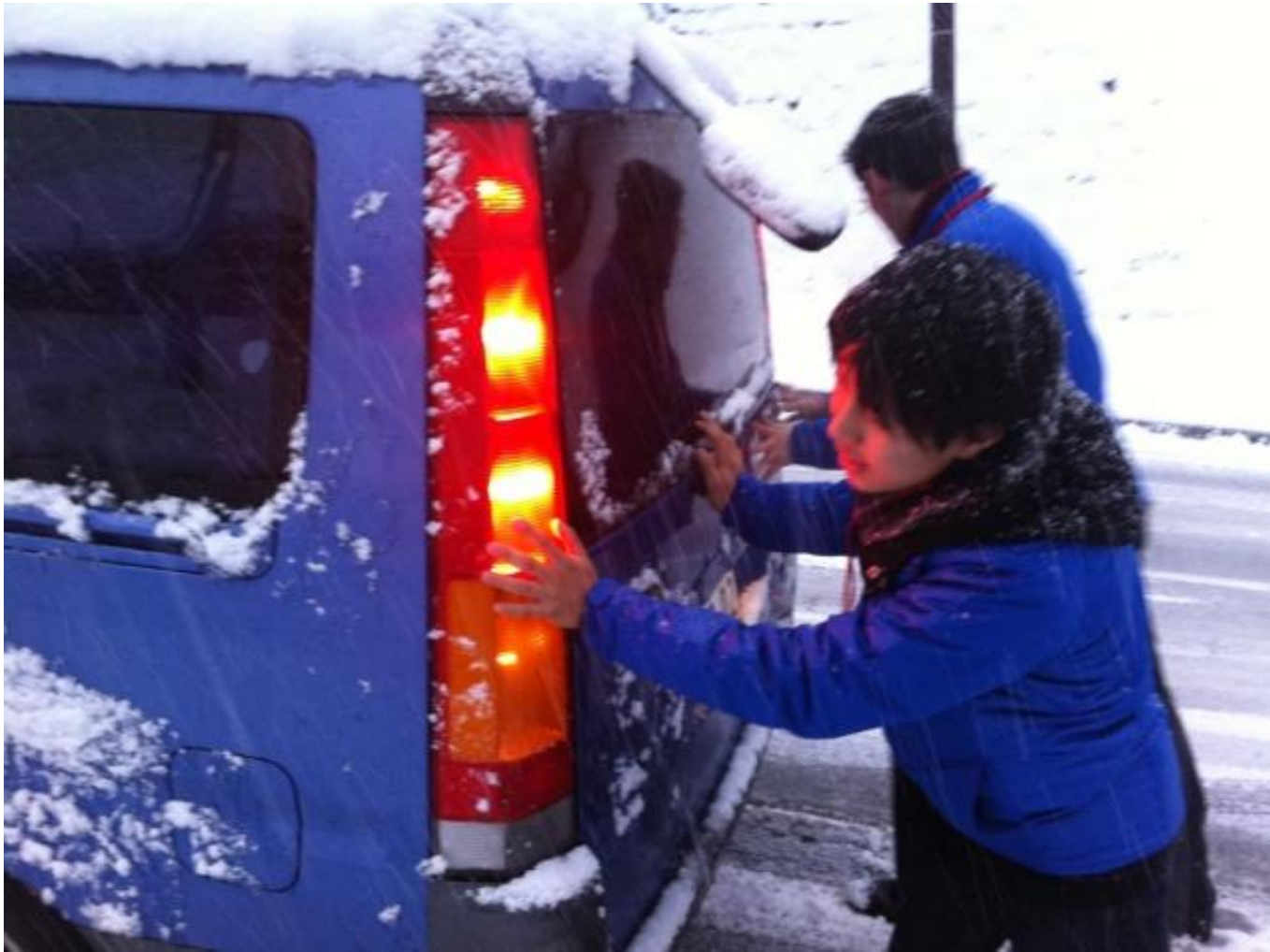
(写真⑥) 雪道で車を押す隊員達