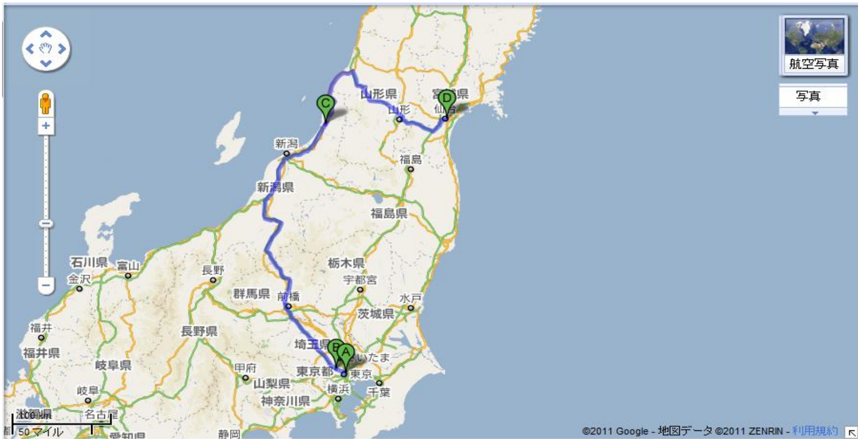
(写真④) 早稲田大学YMCAチームのホルモン剤搬送ルート